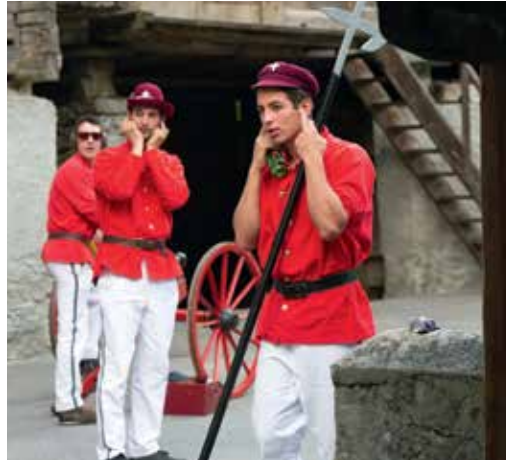
La Jeunesse de Champsec a tiré ses traditionnels coups de canon de la fête patronale de la Saint-Bernard.