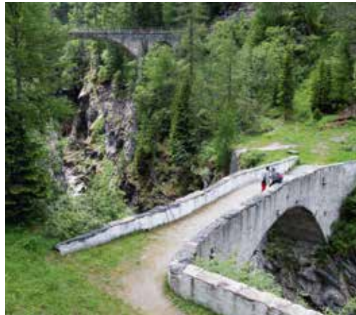
Le pont de Mauvoisin reconstruit en 1828, dix ans après la débâcle, sur les plans d'Ignace Venetz.