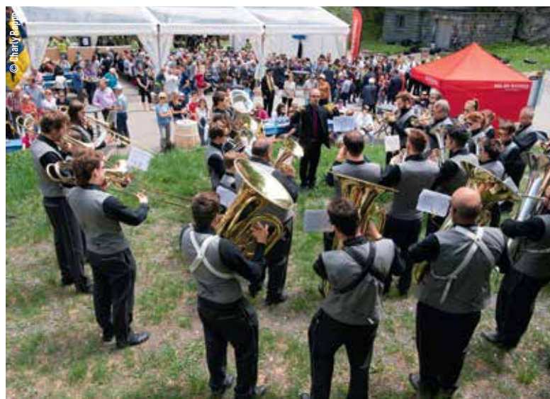
Ambiance festive au pied du barrage de Mauvoisin.

Le 16 juin 1818, la rupture d'une énorme digue de glace au fond du val de Bagnes a causé l'une des pires catastrophes naturelles que le Valais ait jamais connues. Deux cents ans plus tard, la commune de Bagnes a décidé de commémorer ces événements de manière conséquente. « C'est une question de mémoire et de respect pour les victimes », ont relevé plusieurs orateurs lors de ces journées. Le public est venu en nombre participer à ces festivités, où n'ont manqué ni le soleil, ni l'émotion.