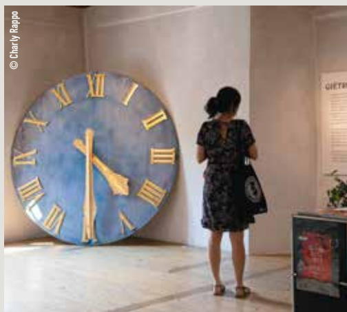
Exposition Giétro 2018-1818 au Musée de Bagnes.