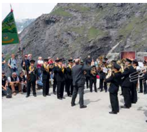
Les fanfares l'Avenir et la Concordia se sont relayées entre les allocutions, avant d'interpréter ensemble l'hymne valaisan « Marignan ».