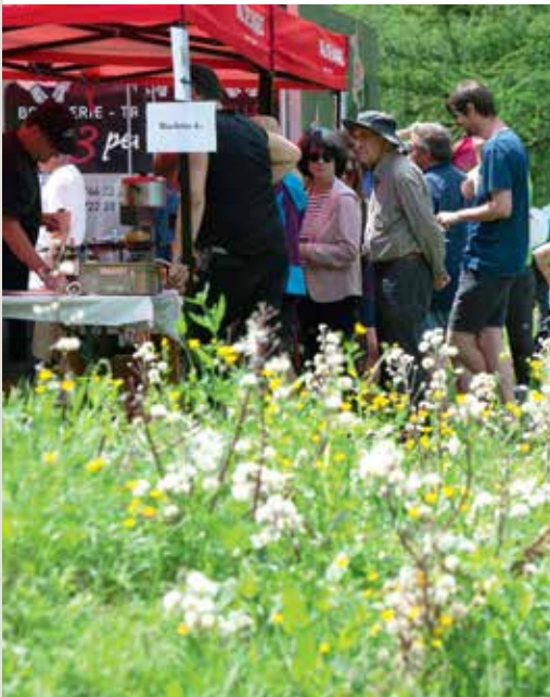
Les sociétés de développement ont organisé les stands de restauration à Mauvoisin, le 16 juin et à Madzeria, le 17 juin, avec le renfort de bénévoles.