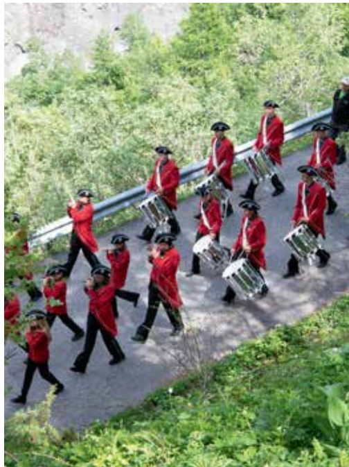
Les fifres, tambours et majorettes de Saint-Georges ont accompagné le public en musique durant tout le trajet.