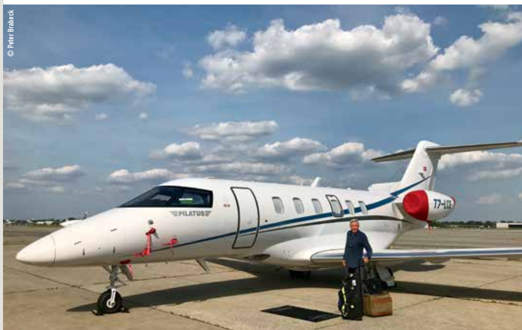
Peter Brabeck-Letmathe devant le tout nouveau Pilatus PC-24 qu'il vient d'acquérir et qui est basé à l'aéroport de Sion.

Peter Brabeck-Letmathe dirige le Conseil de fondation du Verbier Festival. Le résident de Verbier nous parle de son programme pour la 25 e édition et des défis d'avenir du Festival.