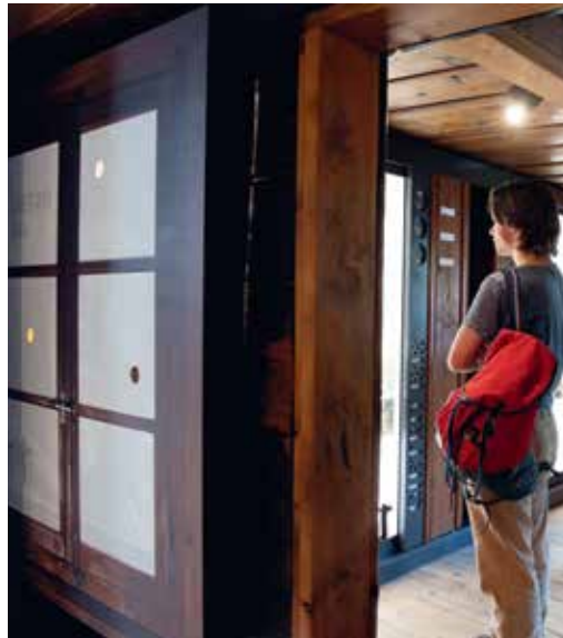
Une nouvelle scénographie a été inaugurée dans la Maison des glaciers à Lourtier.