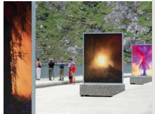
Vernissage de l'exposition « Invitation to Disappear ».