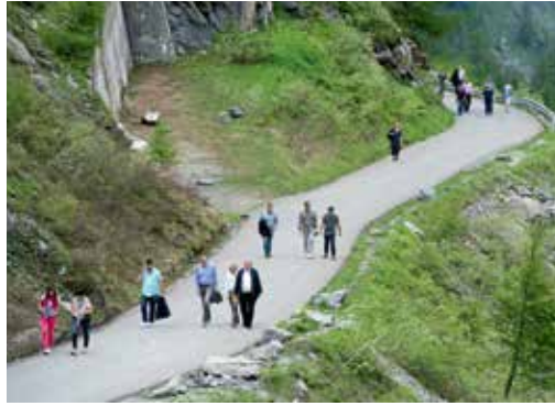
Vers 15 h, tout le monde a rejoint le couronnement du barrage pour la commémoration.