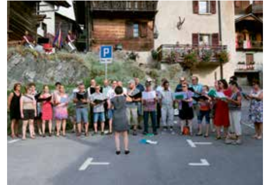
Les Cœurs-unis de Champsec ont interprété plusieurs de leurs chants, dont « Sery-Laly ».