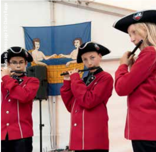
Trois fifres de Lourtier. Les sociétés locales ont animé le repas à Mauvoisin.

Allocutions, vernissages, animations musicales étaient au programme de la journée de commémoration du 16 juin. Le lendemain a été consacré aux ateliers découverte, entre Mauvoisin et Champsec.